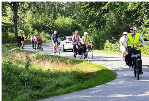
I uppförsbackarna vid St Skyrup

Ett 20-tal deltagare blev det varav någon ny medlem. Det var en sådan söndag som flera föreningar hade aktiviteter kring Hovdala. Hässleholm Hovdala vandrarförening och HeTS (Hessleholms teatersällskap) syntes bland dessa