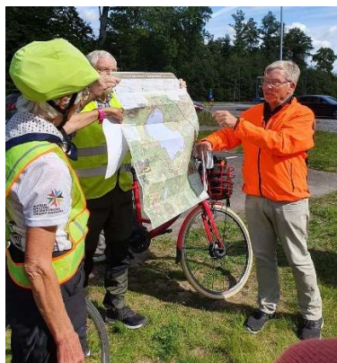
Genomgång för deltagarna vid starten.

Den 5/9 genomförde vi en tur på cykel runt Finjasjön. Egentligen en medlemsaktivitet med en annons i Norra Skåne lockade några övriga. Vi stannade till vid några platser runt sjön där styrelsemedlemmar fanns på plats och berättade kort om vad vi såg och vad som hänt här i gången tid.