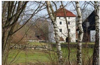
Våren är på väg