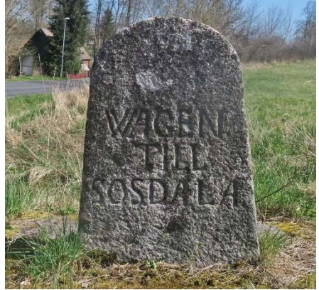
Vägvisarsten i vägskälet vid Gulastorp

vi en praktisk lastplats för timmer i norra slänten av åsen.