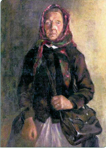
Framsidan på häftet om Posta-Nilla